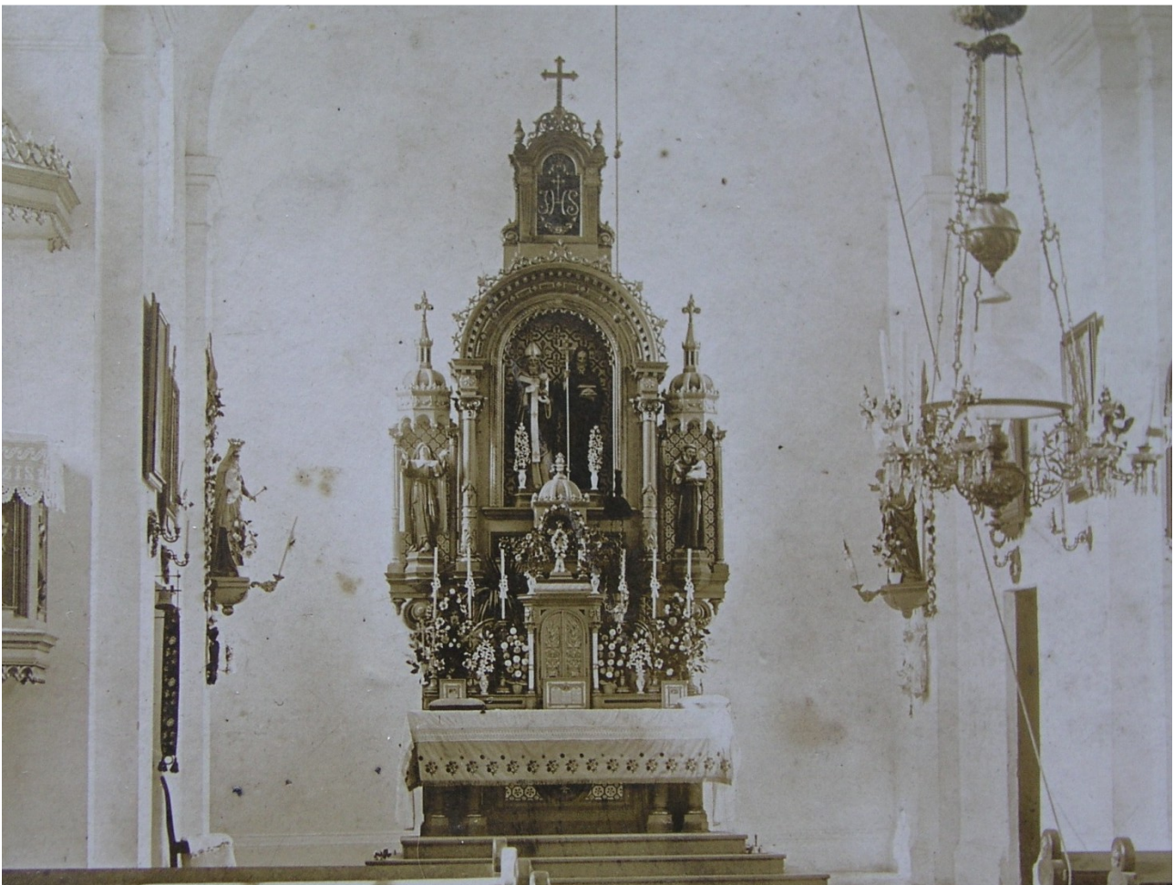
hlavní oltář nového kostela sv. Cyrila a Metoděje ve Věteřově se svými patrony