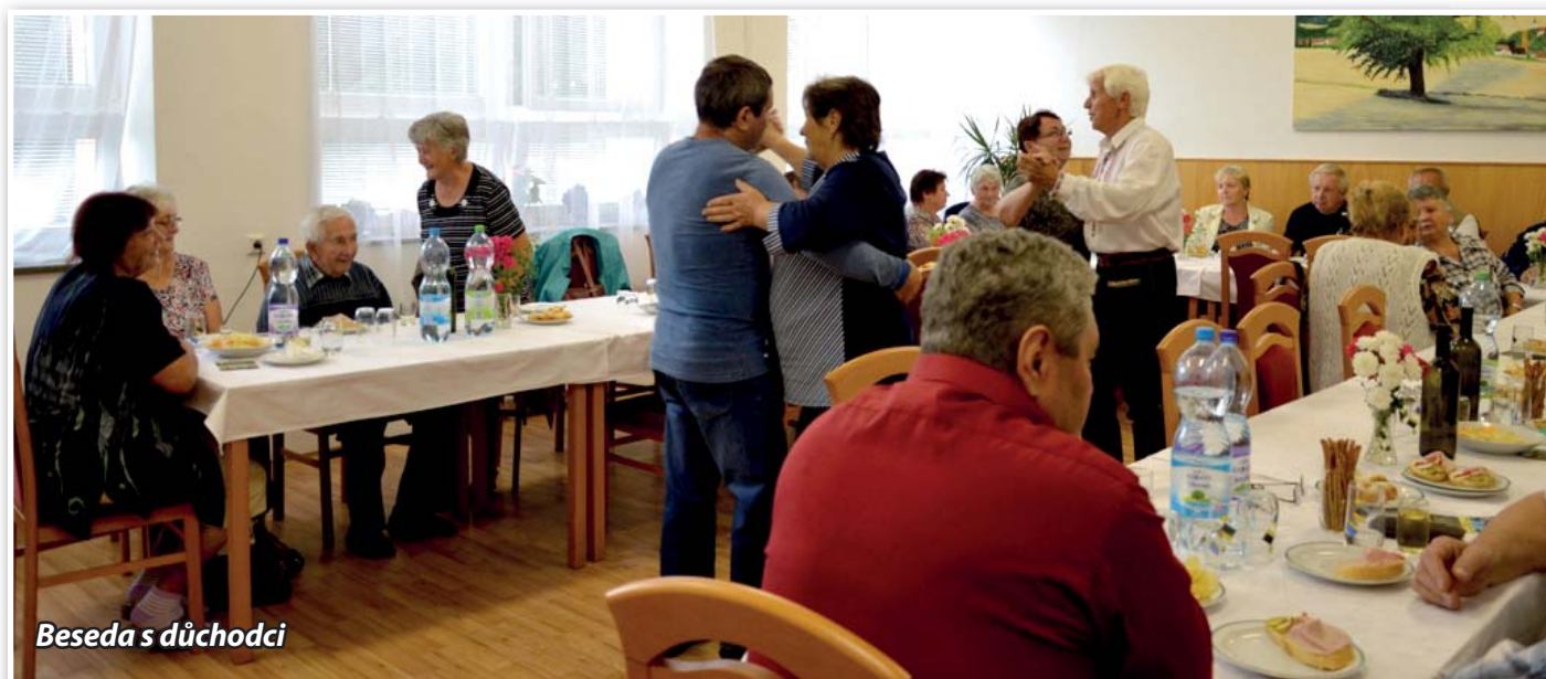
Beseda s důchodci