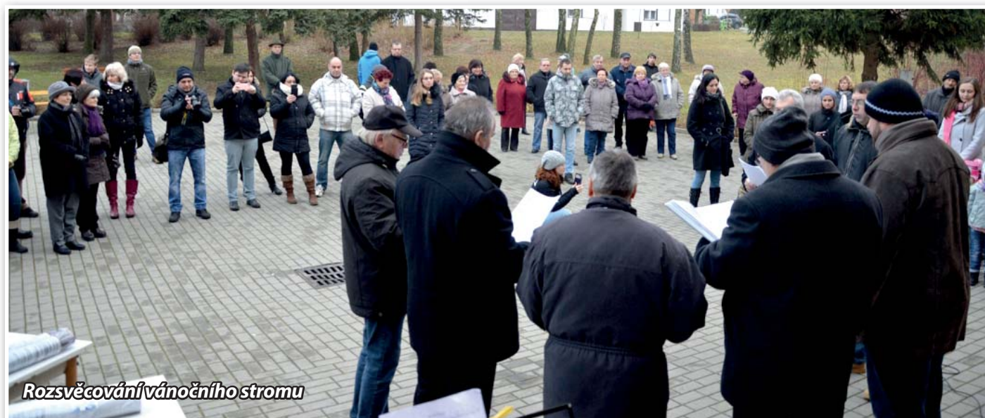
Rozsvěcování vánočního stromu