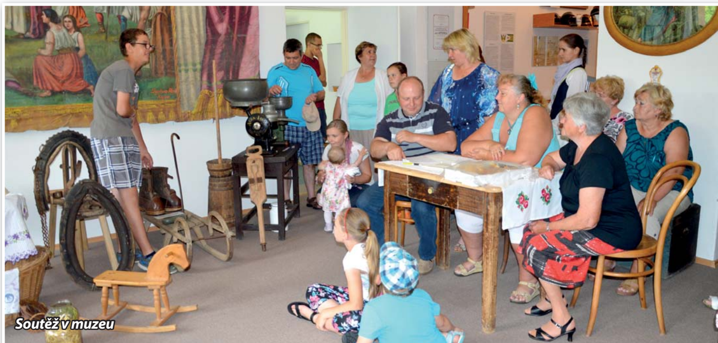
Soutěž v muzeu