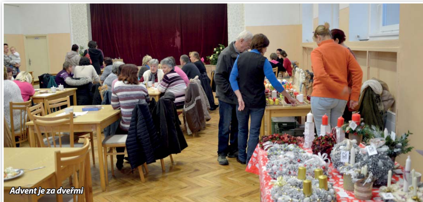
Advent je za dveřmi