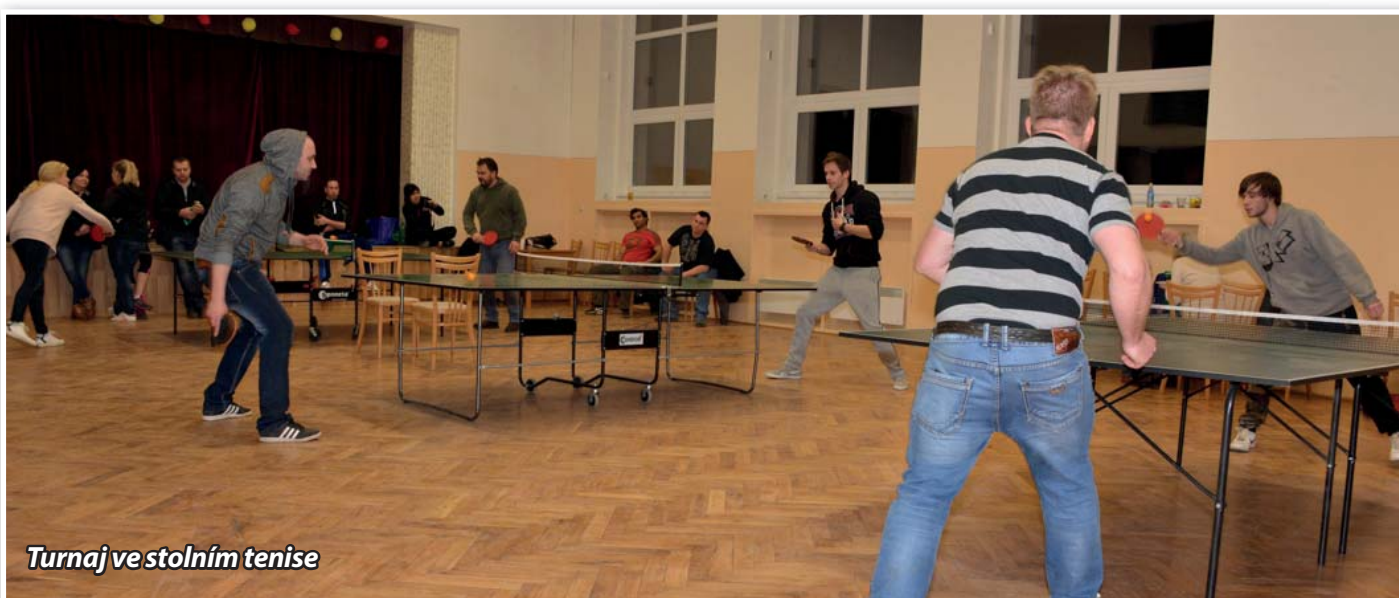
Turnaj ve stolním tenise